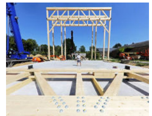
Cirque en dur, Marchin

info@be-cambium.com T : +32 (0)2 315 99 74