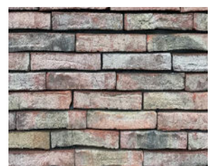
Centre médical, Villers-Outreaux (FR)