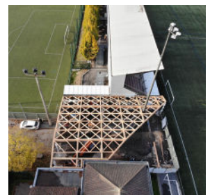
Auvent, Croix (FR)