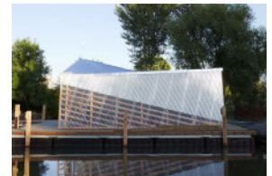
Pavillon d'Amiens (FR)