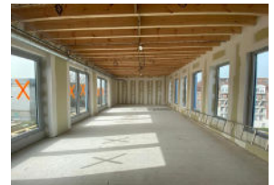
Ugemam, Lille (FR)