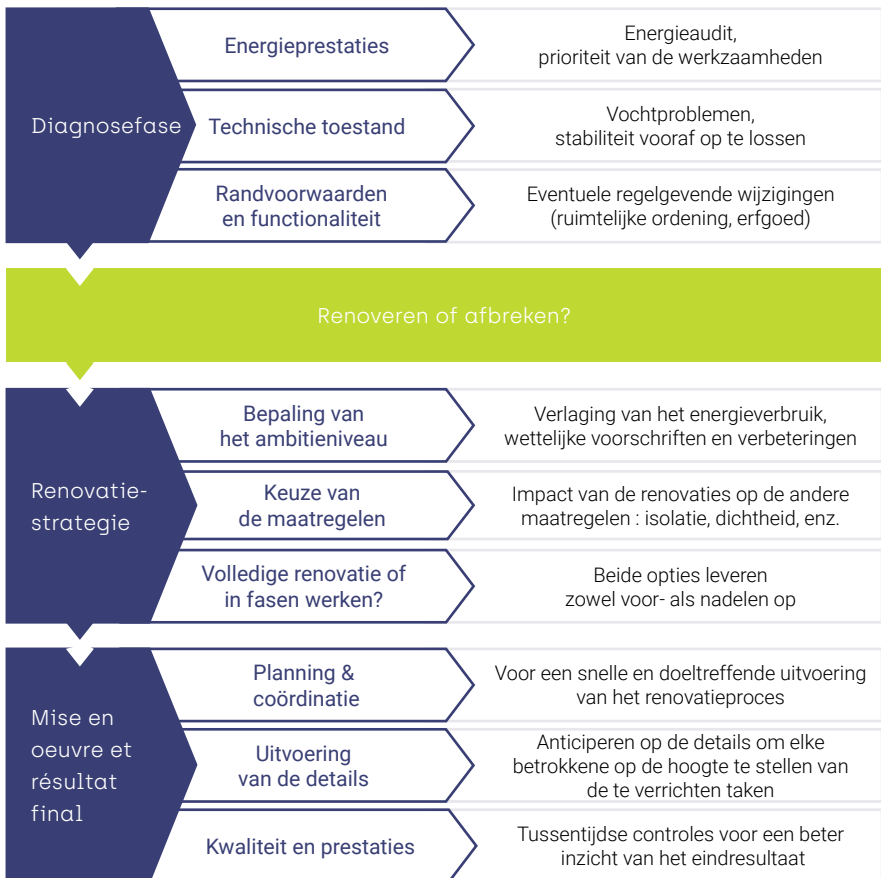
Tabel WTCB – Wetenschappelijk en Technisch Centrum voor het Bouwbedrijf

Zoals reeds gezegd, kunnen de verschillende fasen van een renovatie niet van elkaar worden losgekoppeld. Zorg vanaf de ontwerpfase voor een alomvattende en gedetailleerde aanpak voor het gewenste eindresultaat.